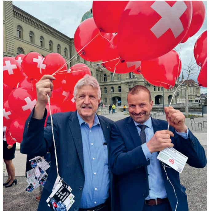
Nein zum EU-Unterwerfungsvertrag! Unsere Nationalräte beteiligen sich an der kreativen Protestkundgebung vor dem Bundeshaus.